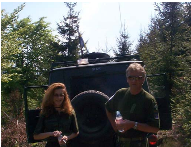
En af vores lokale tolke og en af mine svenske kolleger.

Deres evner til samarbejde er meget forskelligt fra landsby til landsby – her taler jeg om nogle af de landsbyer, der er befolket af mere end én etnisk gruppe. Ofte går det