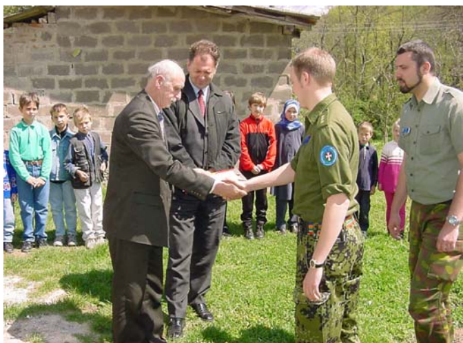
Overdragelsen af en pumpestation betalt af Kolding Kommune.

Her 6 år efter krigen er slut, mangler der stadig meget i genopbygningen af landet. Mange huse ligger stadig som om krigen sluttede i går, og det er en del af mit arbejde, at