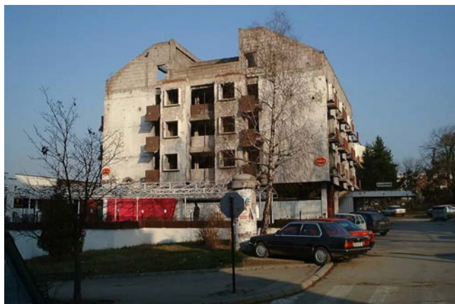
Det tidligere hotel i Derventa

I de vigtigste byer har vi ”CIMIC-House”. Det er et kontor hvor beboerne i området kan komme til os, hvis de har problemer eller sager som de ønsker vi skal se på. CIMIC-house er meget anvendt og vi kommer ofte her i kontakt